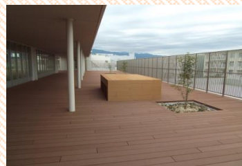
屋上デッキテラス